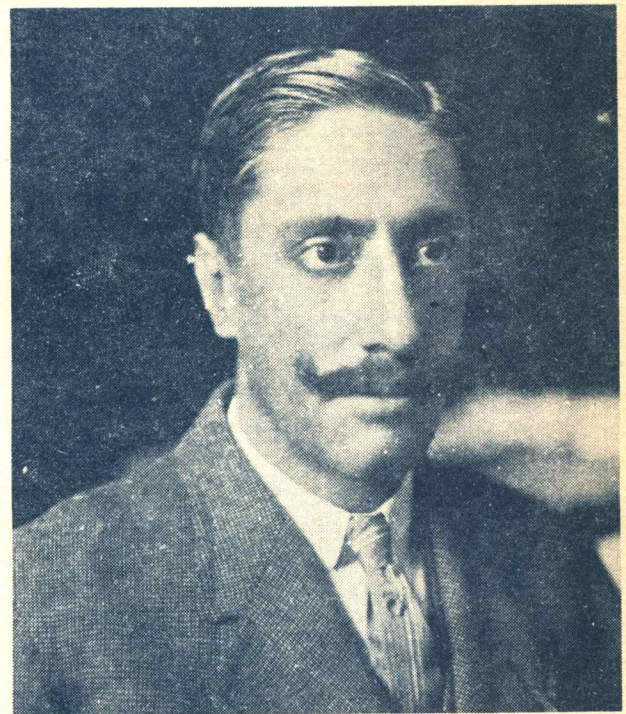
Juan Sánchez Azcona