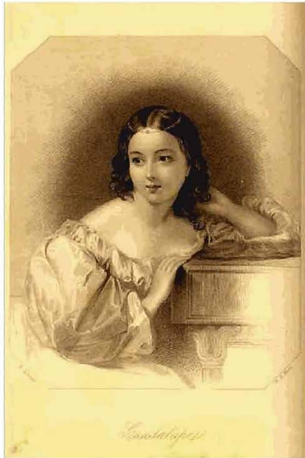
Imagen tomada de la revista Presente Amistoso (1851). Revistas Literarias del siglo XIX. Colecciones Mexicanas. Coordinación de Publicaciones Digitales, DGSCA. UNAM.