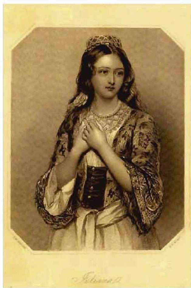
Imagen tomada de la revista Presente Amistoso (1851). Revistas Literarias del siglo XIX. Colecciones Mexicanas. Coordinación de Publicaciones Digitales, DGSCA. UNAM.